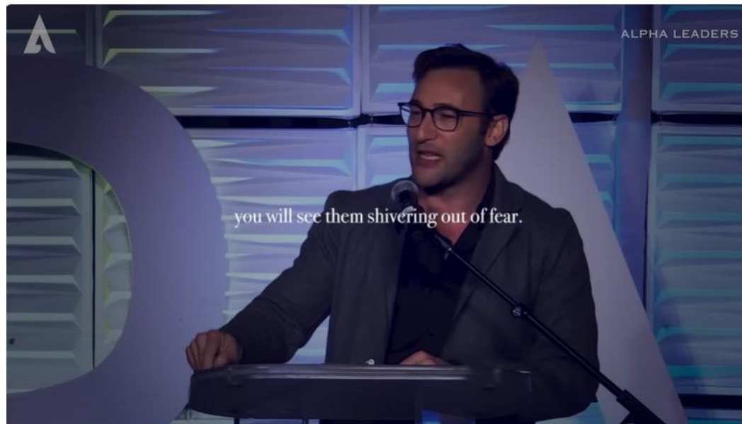
Simon Sinek's Advice Will Leave You SPEECHLESS 2.0 (MUST WATCH)