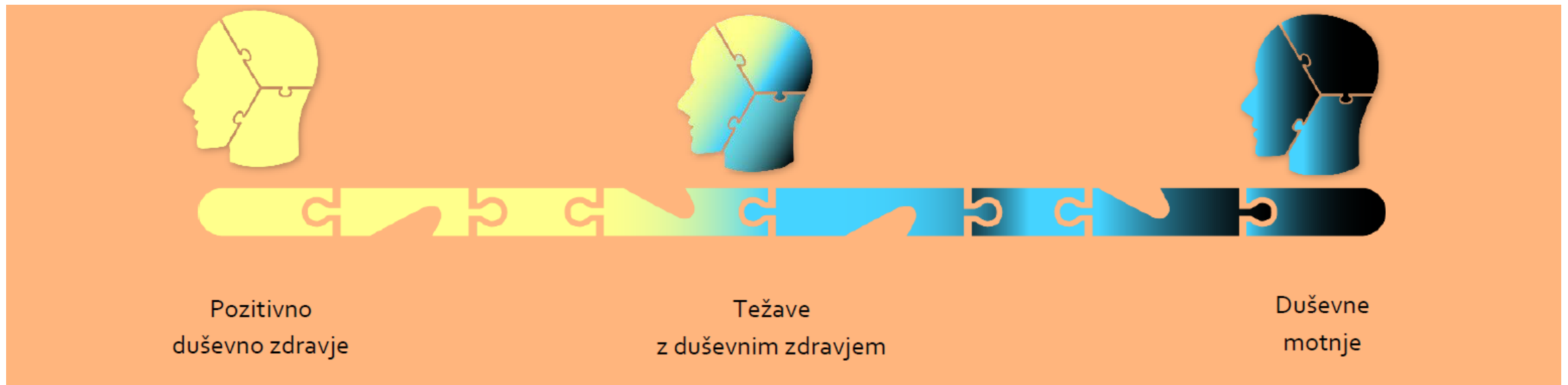
Slika 1. Kontinuum duševnega zdravja (prirejeno po The University of Michigan, 2009)