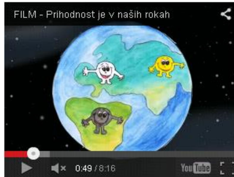
Animirano-dokumentarni film "Prihodnost je v naših rokah"